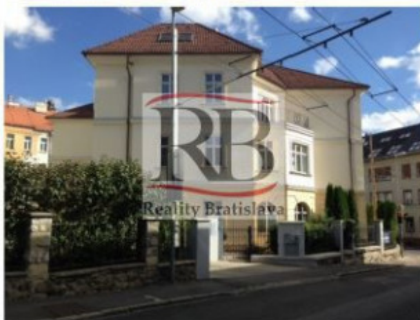
Príjazd zo Sulekovej ulice